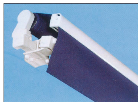
Ansicht der geschlossenen Markise

Um die Gelenkarmmarkise EUROPE 2060 für große Abmessungen auszuweiten, wurde die Markise mit 40er Montagerohr, stranggepreßten Armlagern und Rollenstützlager entwickelt. Ein innovatives Produkt, das sich durch große Ausgereiftheit und eine Vielzahl an Optionen auszeichnet. Besonders zu erwähnen der Vario Volant, Ausfall bis 400 cm und gesonderte Neigungsverstellung der Arme (Duomatic). Diese Markise besitzt eine Regenablaufrinne im Ausfallprofil.