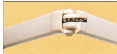
Gelenkarme mit Kette (8000 Bedienzyklen getestet)

Diese Markise mit dazwischen positionierten Edelstahlketten-gelenkarmen ist mit einem verzinkten und pulverbeschichteten 40er Montagerohr ausgestattet. EUROPE 2060 zeichnet sich durch sein neues stranggepreßtes feststehendes Armlager aus, welches eine Neigungsverstellung von 0° - 60° gewährleistet.